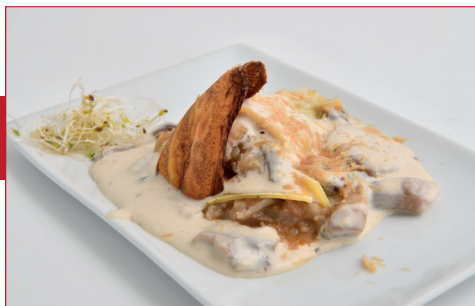
Canelón de pies de cerdo con suave bechamel de foie y setas

C/ de l'Església, 31 Horario: de martes a sábado de 11 h a 13.30 h y de 18 h a 22 h y domingo de 12 h a 13.30 h Descanso semanal: domingo noche y lunes