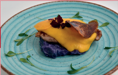
Solomillo de cerdo, mango y patata violeta

C/ Arcadi Balaguer, 35 Horario: de martes a domingo de 12.30 h a 15.30 h y de 20 h a 23 h Descanso semanal: lunes