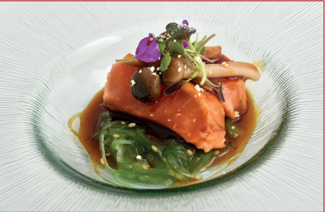
Salmón soasado, marinado en thandao, shimenji y wakame

Carrer 11 (a peu de platja) Horario: de lunes a domingo de 11.30 h a 13.30 h y de 17 h a 21 h Descanso semanal: ninguno