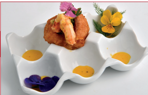
Acarajé con gambita y salsa Bahiana

Passeig Marítim, 74 Horario: de lunes a sábado de 18 a 22 h Descanso semanal: ninguno