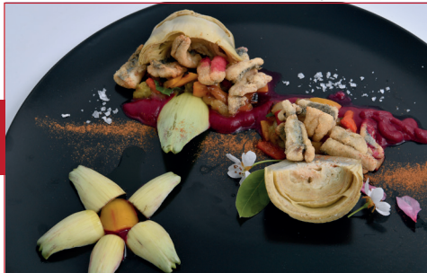
Alcachofa en adobo tierra y mar

C/ Pompeu Fabra, 20 Horario: de martes a sábado de 18 h a 22 h y sábado y domingo de 12 h a 14 h Descanso semanal: domingo tarde y lunes