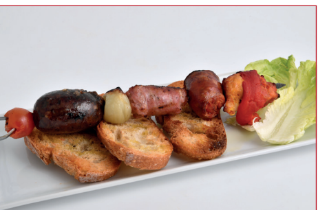
Los sueños se cumplen echándole huevos

Passeig Marítim, 214 Horario: de lunes a sábado 13.30 h a 15.30 h y de 20.30 h a 22 h Descanso semanal: martes