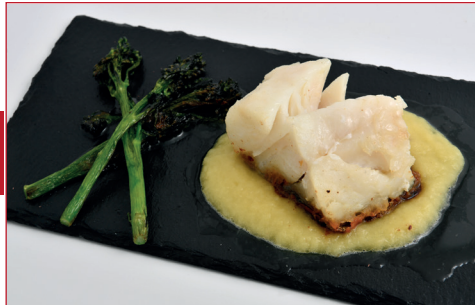
Bacalao a la crema de piña

Av. Canal Olímpic, 24 L- A05-06 C.C. Anec Blau Horario: de lunes a domingo de 12 h a 23 h Descanso semanal: ninguno