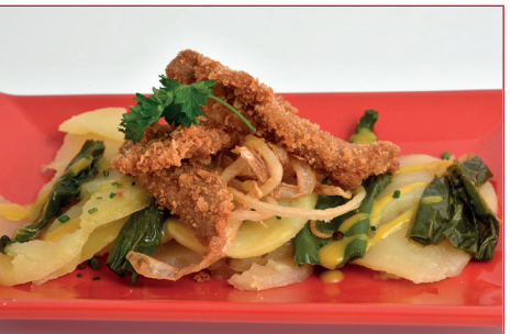
Secreto empanado con panadera, pimientos y salsa mostaza y miel

Av. de Santa Maria, 3 Horario: de lunes a domingo de 13 h a 16 h y de 19 h a 22 h Descanso semanal: ninguno