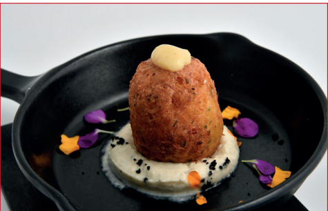
Buñuelo liquido de bacalao ahumado, curd de limón y berenjena

Passeig Marítim, 169 Horario: de martes a sábado de 11.30 h a 13.30 h y de 20 h a 22 h Descanso semanal: domingo noche y lunes todo el día