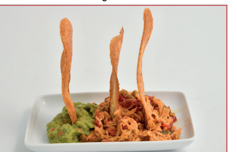
Pollo salteado con chips de plátano macho y guacamole

Av. de la Constitució, 142 Horario: de lunes a sábado de 10 h a 23 h Descanso semanal: domingo