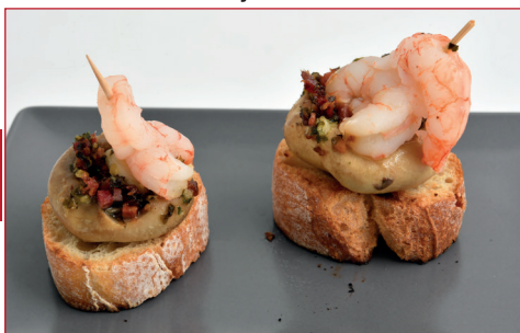
Champiñones mar y montaña

C/ Pintor Serra Santa, 15 local 7 Horario: de lunes a domingo de 12 h a 22 h Descanso semanal: lunes y martes noche