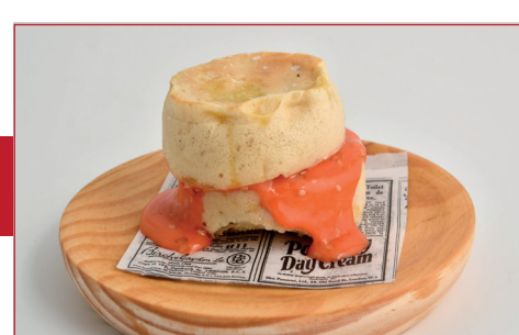
¿Dónde está el jamón?

C/ Ribera de Sant Pere, 15 Horario: de martes a sábado de 11.30 h a 13.30h / viernes y sábado de 20 h a 22 h Descanso semanal: domingo noche