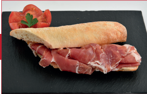
Pulga de paleta ibérica de bellota

Av. de la Constitució, 141 Horario: de lunes a sábado de 11 h a 13.30 h y de 17 h a 20 h Descanso semanal: domingo