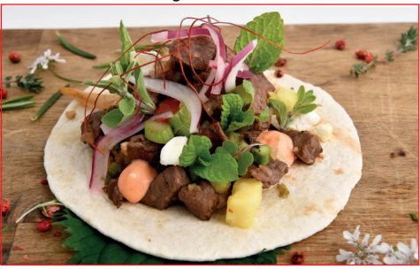
Taco de ternera Eco, cebolla encurtida, sirasha y hierbas frescas

Passeig Marítim, 297 Horario: de martes a sábado de 12 h a 15 h y de 20 h a 22 h y de domingo de 12 h a 15 h Descanso semanal: ninguno