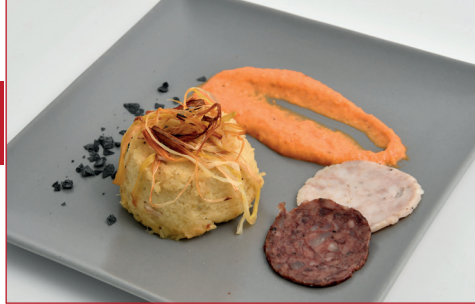
Calçotada de primavera

C/ Huelva, 10 Horario: lunes 12 h a 16 h y de miércoles a domingo de 12 h a 16 h y de 20 h a 23 h Descanso semanal: lunes noche y martes todo el día