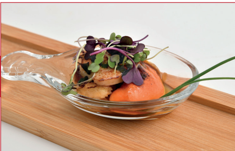
Zamburiña sobre salsa de ostras y foie

Platja Pineda, 1 (darrere Parc de les dunes) Horario: de lunes a domingo de 11,30h a 13,30h y de 17h a 20,30 h Descanso semanal: ninguno