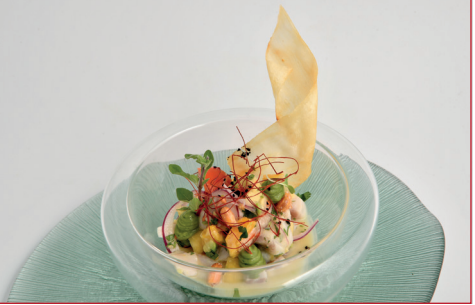
Ceviche de pescado blanco, aguacate, coco y maíz crujiente

Passeig Marítim / Carrer 6 (a peu de platja) Horario: de lunes a domingo de 11.30 h a 13.30 h y de 18.30 h a 21.30 h Descanso semanal: ninguno