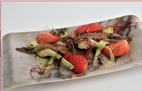
Mar y montaña de alcachofa, anchoa, fresca y vinagreta de manzana

Passeig Marítim, 38-42 Horario: de lunes a domingo de 10h a 12h y de 17h a 20h Descanso semanal: lunes noche y martes todo el día