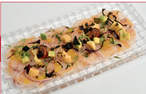
Tiraditos de corvina con caviar de lima

Ribera Sant Pere, 1 - 9 Horario: de lunes a domingo de 11 h a 13 h y de 20.30 h a 23 h Descanso semanal: martes