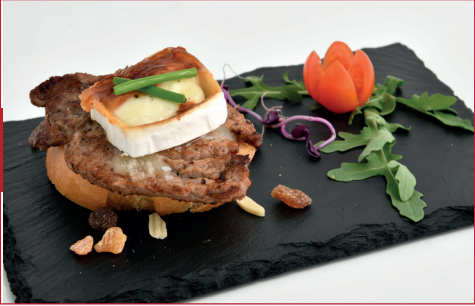
Montadito de solomillo

C/ Arcadi Balaguer, 33 Horario: de lunes a domingo de 16 h a 23 h Descanso semanal: jueves tarde