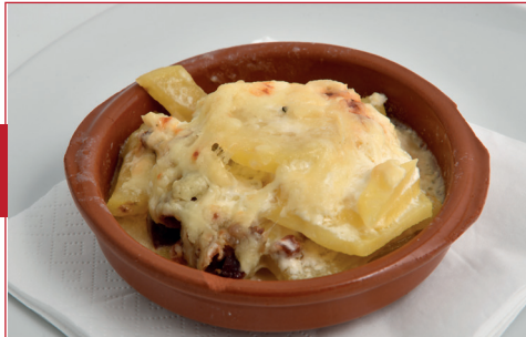
Tartiflette de patata y jamón

C/ de l'Església, 59 Horario: de lunes a domingo de 12 h a 14 h y de 18 h a 21 h Descanso semanal: sábado todo el día y domingo noche