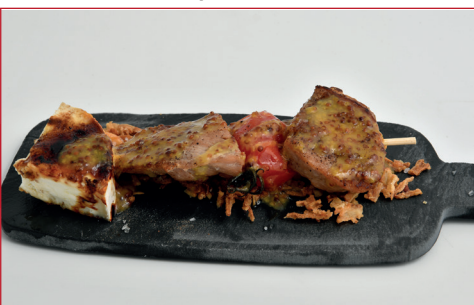
Ruta de sensaciones

Rambla Josep Tarredellas, 9 Horario: de lunes a domingo de 12 h a 23 h Descanso semanal: ninguno