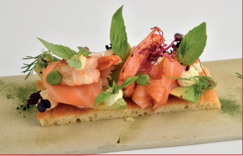
Focaccia Vertical de salmón ahumado, aguacate y mayonesa cítrica

Final del carrer Auet (a peu de platja) Horario: de lunes a domingo 11.30 h a 13.30 h y de 18.30 h a 21.30 h Descanso semanal: ninguno