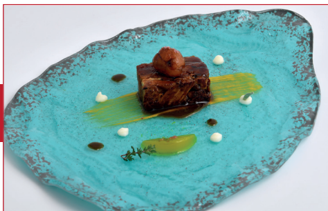
Prensado de cordero lacado con miel de Begues y cremoso de celeri

Av. de la Constitució, 135 Horario: de miércoles a sábado de 20 h a 23 h Descanso semanal: domingo y martes noche y lunes todo el día